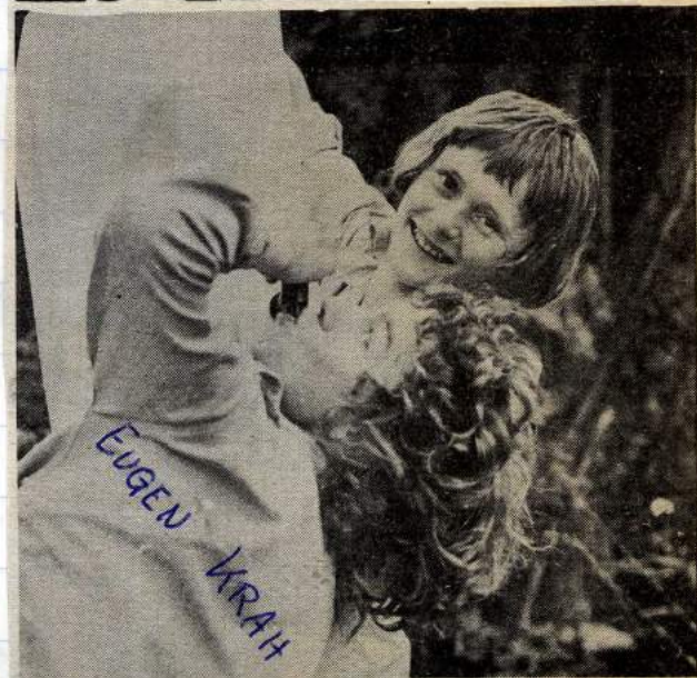
AHH-schönes Wasser. To tyske speidere smaker på det medbrakte norske kildevannet.