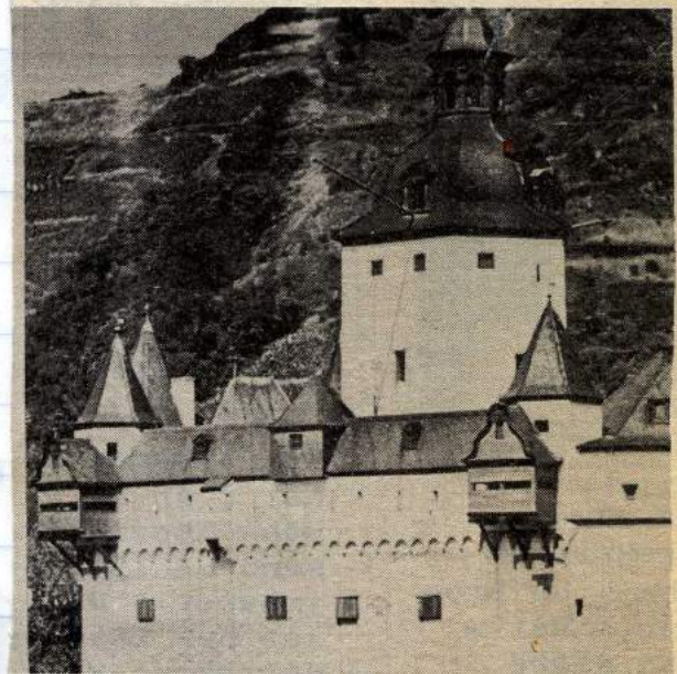
En av de mange borgene langs elva Rhinen

speidervenner. Leiren var ikke akkurat en norskpreget leir med haik og pionerarbeider. Dette skyldes den store mangelen på friluftsområder. Hvor vi enn snudde oss så vi ikke annet enn fabrikker, motorveier og høyblokker. Selv om det rente en forlakkende bekk like ved teltene måtte vi gå til nærmeste gård for å få drikke og vaskevann. Dette skyldtes den store forurensningen som Tyskland er plaget av. De tyske speiderne gleder seg til å komme til Norge sommeren 1975 og se og oppleve vår vakre natur.